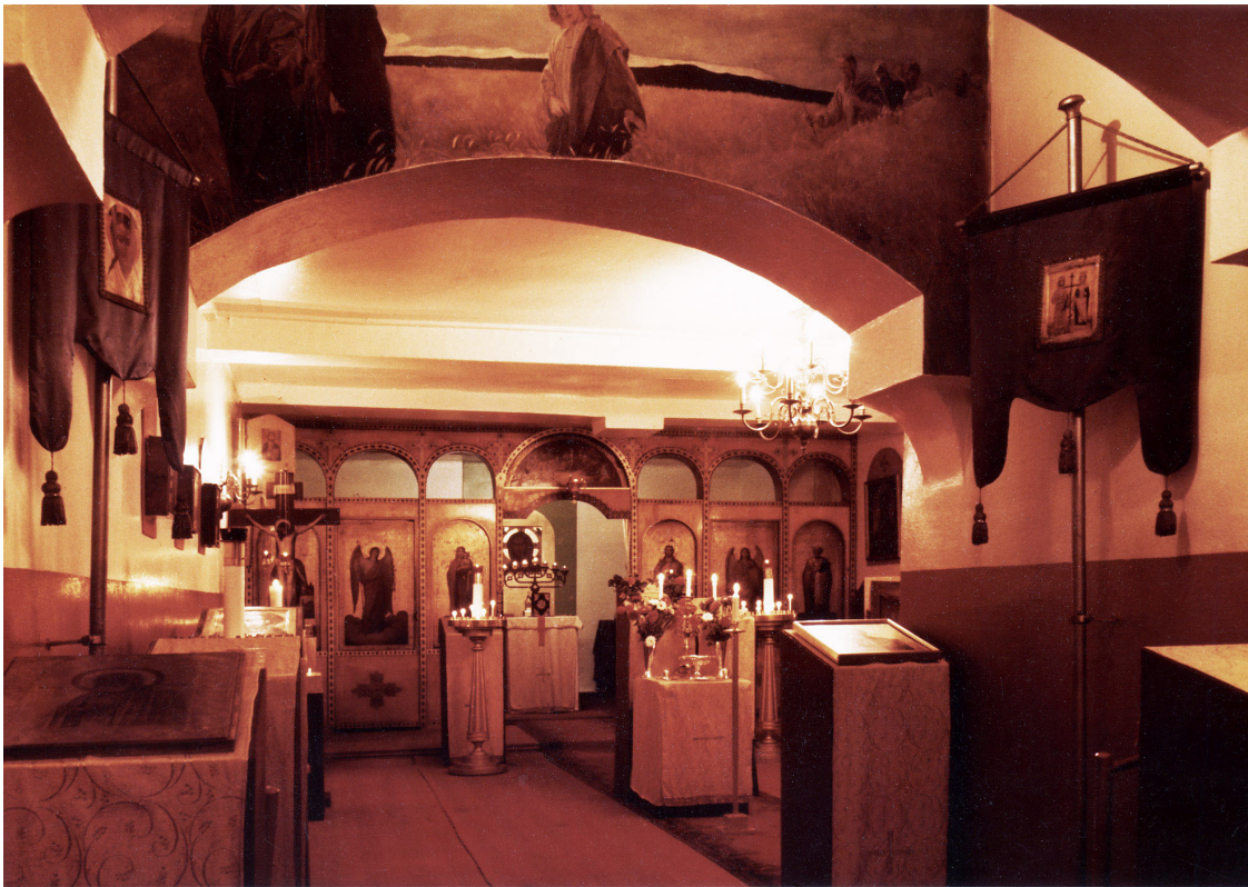
Нl. Nikolai russisk-ortodokse kirke i Oslo. Foto fra 1962.