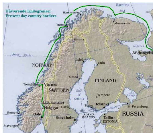
Маршрут путешествия белоэмигрантов, прибывших в Норвегию на ледоколе «Кузьма Минин» весной 1920 г.